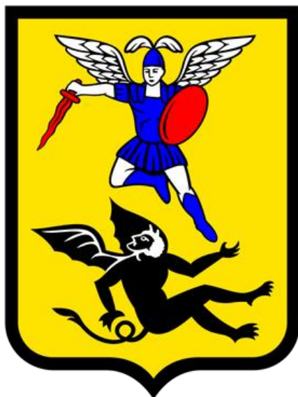
Схема теплоснабжения городского округа «Город Архангельск» до 2040 года