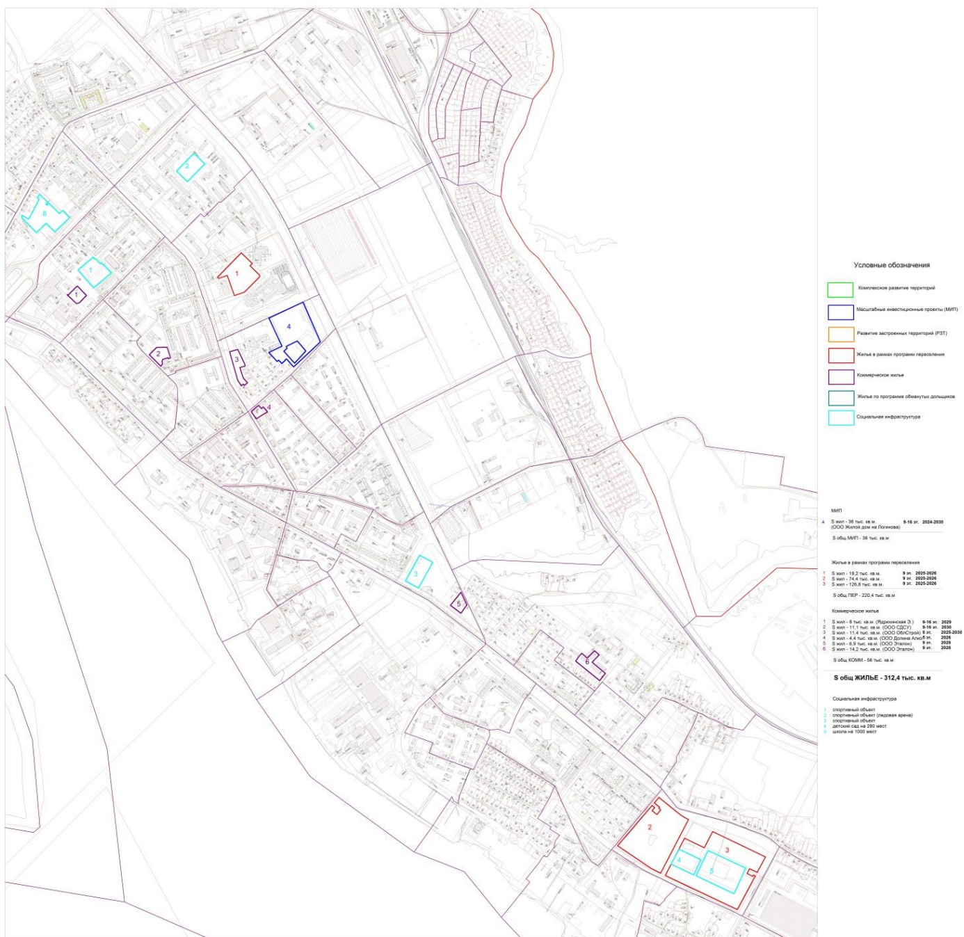
Рисунок 8.2 Участки перспективной застройки в округе Варавино-Фактория